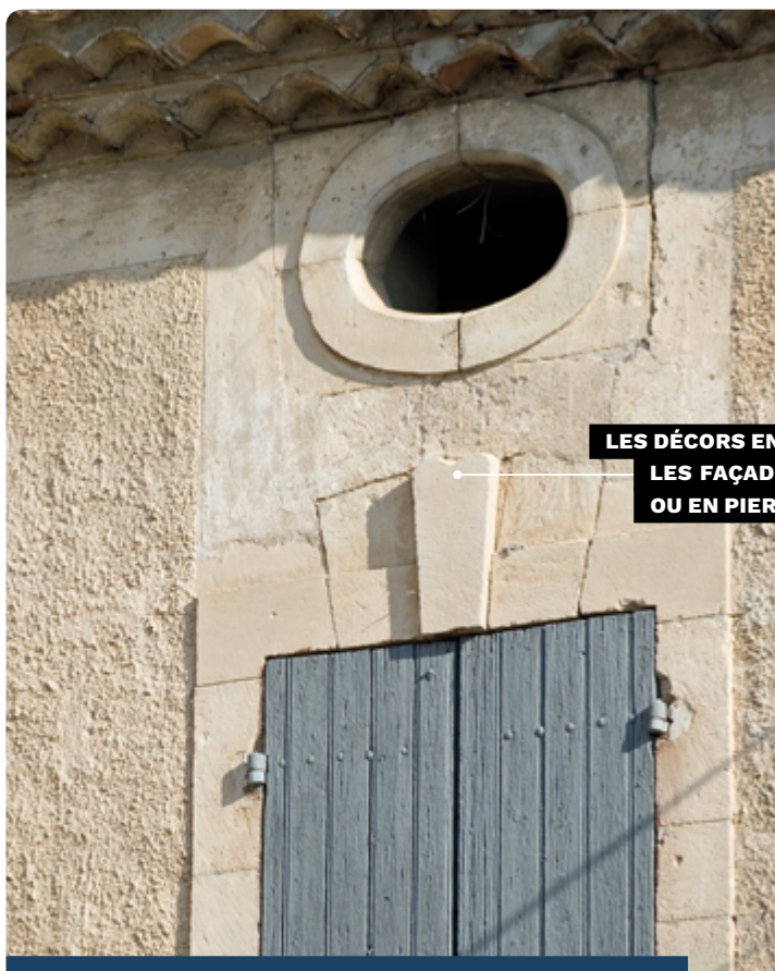
LES DÉCORS EN PIERRE ORNENT LES FAÇADES ENDUITES OU EN PIERRE DE TAILLE